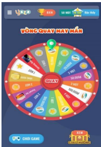
Hình ảnh về vòng quay may mắn